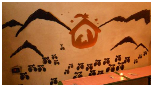
Il presepio del Veloce Club