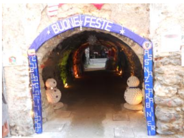
Il volto della Bocciofila